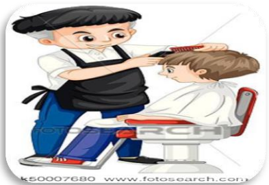
المهنة : .....