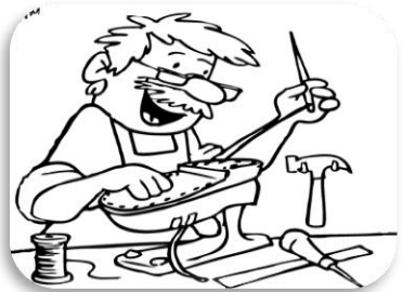
المهنة : .....