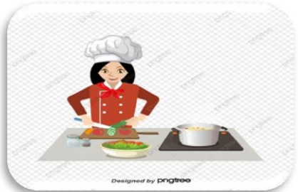
المهنة : .....